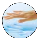
VISCOELÁSTICA CON GEL