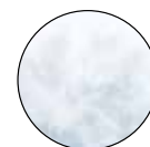
ACOLCHADO CON FIBRAS HIPOALERGÉNICAS